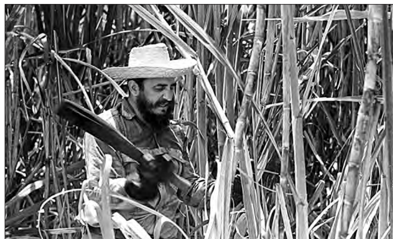
Fidel en la zafra

En la madrugada del 1º de enero de 1959 Batista huyó y la dictadura cayó. El gobierno yanqui -aunque sin duda lamentó la caída de su dictador/títere- el 7 de enero reconoció al nuevo gobierno. Había particularidades importantes en el proceso cubano. El castrismo era una dirección nacionalista democrática y pequeñoburguesa, independiente del partido stalinista burocrático que dominaba en la URSS. Para su lucha habían contado con el apoyo de sectores burgueses cubanos y latinoamericanos, así como de sectores del propio imperialismo yanqui. La revista Life publicó en enero las fotos de los triunfantes "barbudos" diciendo que habían derrocado al régimen "opresor, corrompido y comercialmente astuto de Batista". El pequeño PSP (Partido Socialista Popular) era la versión local de los partidos comunistas stalinistas. Y durante años había rechazado y criticado duramente la lucha guerrillera. A último momento se había sumado al carro de los vencedores y sus dirigentes estaban intentando