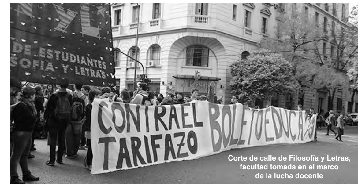
Corte de calle de Filosofía y Letras, facultad tomada en el marco de la lucha docente

Por un lado hay un presupuesto congelado con respecto a 2015 (el incremento ha sido del 1%) que le plantea a muchas universidades el hecho cierto de que en la segunda mitad del año ni siquiera puedan pagar la luz y el gas. Por el otro, el gobierno ofrece una propuesta salarial irrisoria. Una verdadera provocación: 15% en junio, 5% en noviembre y 11% en enero de 2017. Por debajo de lo que está arreglando cualquier sector; de la paritaria docente nacional e incluso de las provinciales. Encima, estos montos son sobre los salarios anteriores de miseria. Hoy, un ayudante de primera con dedicación simple cobra un "sueldo" de 3.000 pesos. Y el cargo testigo (ayudante de primera con dedicación semi exclusiva, equivalente en carga horaria a maestro de grado) percibe en mano 6.500