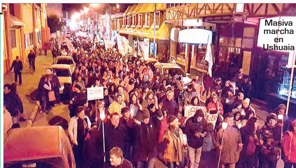
Masiva marcha en Ushuaia