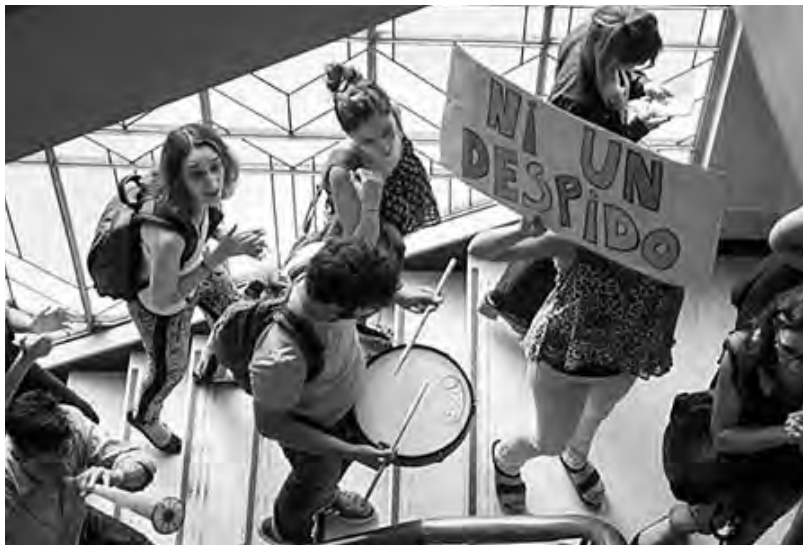
Marcha en el ministerio de Economía

El presidente Macri y el conjunto de la patronal pusieron el grito en el cielo: querían "vía libre" para seguir echando sin ninguna limitación. Por eso se lanzaron a cuanta maniobra fuera posible para evitar tener que pagar un centavo de más. Macri les garantizó a los empresarios que, si la ley era aprobada, él la vetaría. Pero el objetivo de los Moyano-Massa y el kirchnerismo tampoco era detener la ola de despidos. Sólo querían dar "una señal" de que ellos son opositores. A la vez, reflejaba la presión de las bases a la burocracia sindical, apretada por la bronca de que "no hacían nada". El proyecto recibió su primer guadañazo en el Senado: aprobaron una versión que de movida sólo limita el alcance de la ley